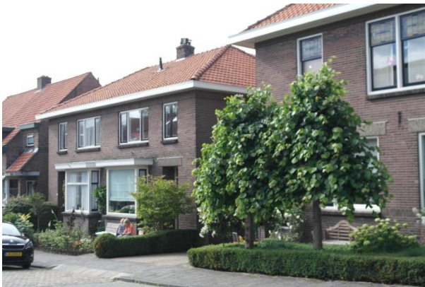
Burgemeester Trooststraat 7 (middelste huis)