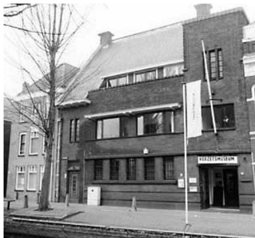
Bank Wed. Knox en Dortland, Turfmarkt 30 Gouda