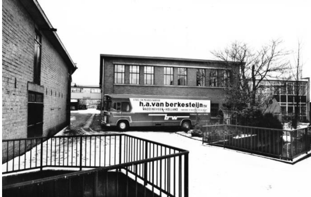
De fabriek met de eerste vrachtauto