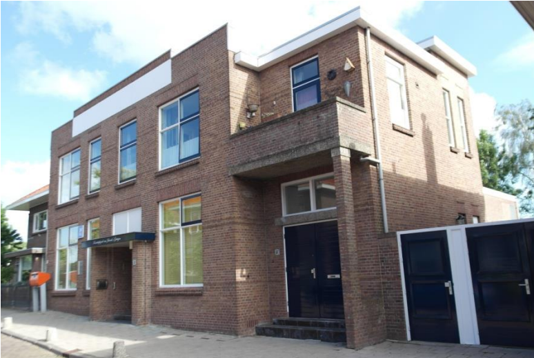
Verenigingsgebouw, Burg. Trooststraat 4

In de jeugd van Gerard was tegenover het ouderlijk huis op Trooststraat nr. 4 wel een rooms katholiek verenigingsgebouw, eigendom van de RK kerk, waar je feesten met een katholieke tint kon geven. Daar werd ook het Sinterklaasfeest gehouden. De fa. Okkerse gaf heel genereus altijd veel speelgoed: alle kinderen kregen iets! Het was een grote (kale) zaal met een toneel, losse stoelen, niet heel fraai of luxe. Er was altijd toezicht in het gebouw, ze gingen er dansen leren en er werd ook toneelgespeeld. Schoenmaker Boere, de vader van zijn klasgenoot Michel Boere, schreef de toneelstukken die er werden opgevoerd, wat met affiches werd aangegeven in Waddinxveen. Verder stond er ook een biljart.